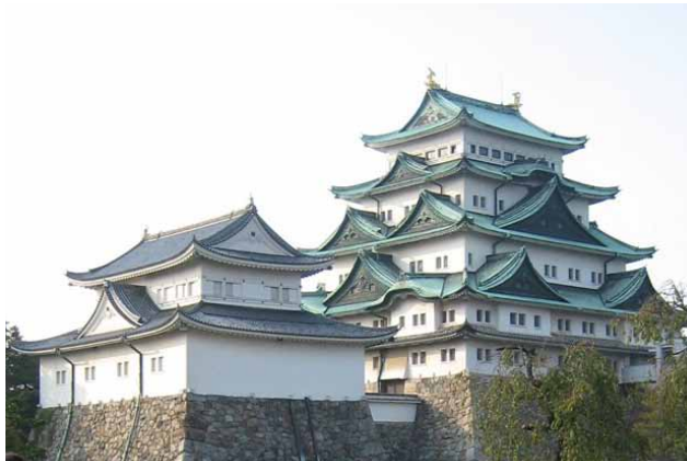
(左)名古屋城菊花総合花壇 (右)徳川園 夜間開園

名古屋城は織田信長誕生的那古野城跡に徳川家康が築城。御三家尾張徳川家17代の居城となり、文化や交易の栄える都市の中心になる。本丸御殿は狩野貞信や探幽など狩野派絵師により、部屋ごとの題材で床の間絵、襖絵などが描かれる。二代藩主・光友の隠居所・大曾根屋敷は池泉回遊式の荘厳な大名庭園・徳川園となる。