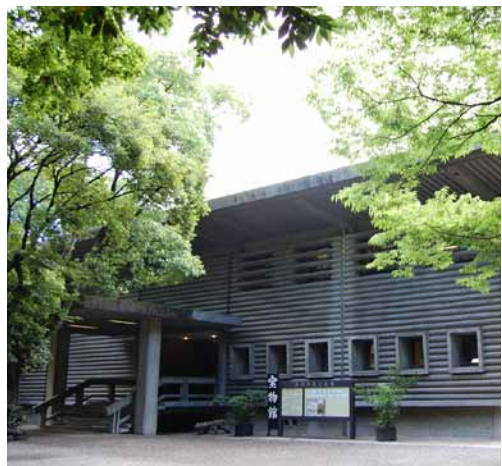
熱田神宮宝物館