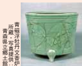
青森県立郷土館 所蔵・写真提供: 郷土館