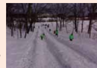
昨年度の大形スベリ台の様子

恒例の縄文冬祭りを開催。縄文時遊館ではクイズラリーや縄文グッズ作り、縄文生活体験コーナーを、また、遺跡内では大型スベリ台や雪だるま広場を予定。冬のさんまを満喫。