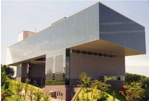
(左)秋田県立近代美術博物館

秋田県立近代美術館では江戸時代中・後期に秋田藩主や家臣がさかんに描いていた洋風画「秋田蘭画」を始め、近代以降のすぐれた美術作品を収集・展示。また鮮やかな画像で世界の名作や館蔵作品を紹介するハイビジョンギャラリーもある。近代美術館の周辺には、大きく見下ろすキリンをはじめ30体以上の彫刻がちりばめられる。