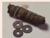
「北海道志海苔中世遺構出土銭」

開拓使函館飯博物場を發祥の地とする当館130年以上の歴史を示す「自然」「考古」「美術」「歴史」コレクションを全て公開し、伝統的総合ミュージアムのその姿に触れる。