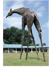
(右) 好奇心 安藤忠雄 1998年

秋田県立近代美術博物館 秋田県横手市赤坂字富ヶ沢62-46 TEL:0182-33-8855 (開)9:30~17:00 (休)1月メンテナンス期間 (料)無 特別展(一般有料)