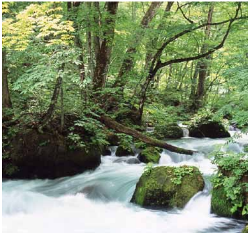
奥入瀬溪流・阿修羅の流れ