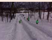
昨年度の大型スベリ台の様子

恒例の縄文冬祭りを開催。縄文時遊館ではクイズラリーや縄文グッズ作り、縄文生活体験コーナーを、また、遺跡内では大型スベリ台や雪だるま広場を予定。冬のさんまを満喫。