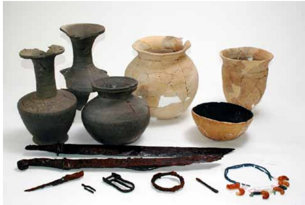
(左)天神山遺跡出土遺物

東の太平洋に向う傾斜台地にあるおいらせ町には、縄文時代から豊かな自然とともに連綿と続く歴史と美。国内最古大型住居遺跡「中野平遺跡」は縄文時代早期の遺跡、発見された12棟の堅穴住居跡。「阿光坊古墳群」からは、数多く勾玉・管玉・刀が出土。聖福寺には「聖観世音菩薩立像」はふくよかで、美しい面相を持ち量感みなぎる。