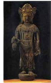
(右)聖観世音菩薩立像

中野平遺跡/ 阿光坊古墳群 (問合せ)おいらせ町役場 商工観光課 TEL:0178-56-4703