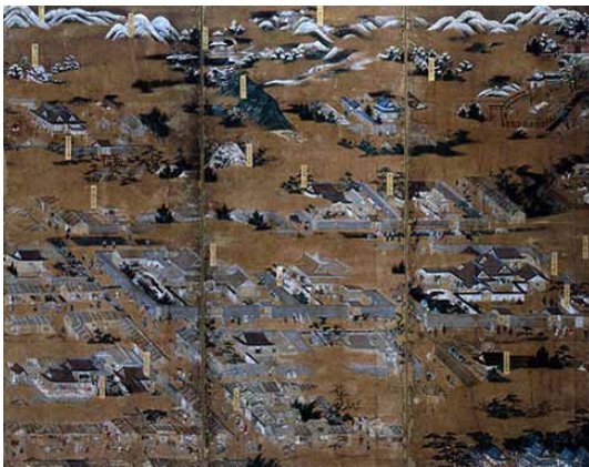
重文 洛中洛外図屏風歴博甲本 左隻(部分)