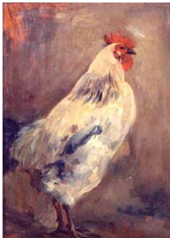
にわりり 浅井忠 1902年