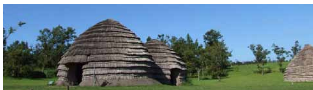
上野原縄文の森 復元集落遠景 約9500年前(縄文時代早期前葉)国指定史跡