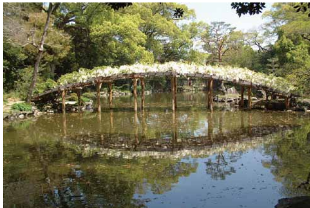
(左)白藤太鼓橋 写真提供:宇和島市観光協会 (右)宇和島城 写真提供:宇和島市観光協会

宇和島城は海と山に溶け込んだ優美な城。1601年藤堂高虎が創建、1615年以降伊達家9代の居城で、現存12天守のうち唯一の海城。海を埋め立てて造成した浜御殿の一部を、慶応3(1868)年の幕末に七代藩主の伊達宗紀が鬼ヶ城連峰を借景に池泉回遊式の庭園を築庭。伊達家の祖先が藤原氏ということから多くの藤が植えらる。名の由来は、伊達政宗晩年の詩の中の、『樂しまずして是を如何せん。残軀は天の赦す所』に由来。