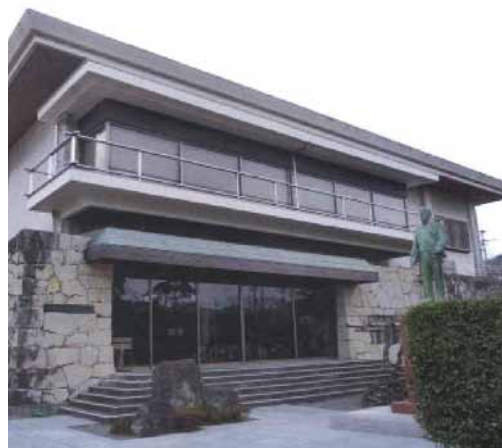
宇和島市立伊達博物館