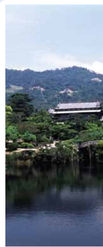
毛利氏庭園