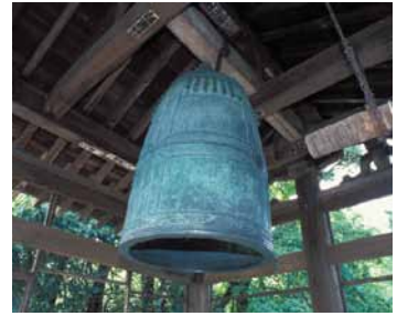
観世音寺 光明禅寺 (問合せ)太宰府観光協会 TEL:092-925-1899