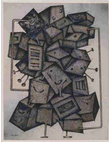
「つくも神」池田龍雄 1995年 所蔵:東京都練馬区立美術館