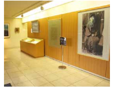
二本松市智恵子記念館 福島県二本松市油井字漆原町36 TEL:0243-22-6151 (開)9:00~16:30 (休)水、祝日の場合翌日 (料)大人400円、小人200円