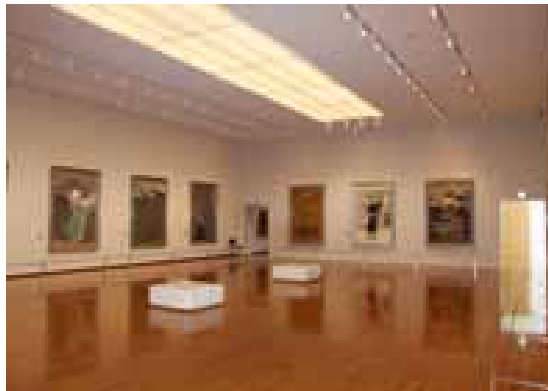
(左)第一展示室 (右)美術館入口