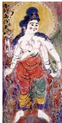
御吉祥大辨財天御妃尊像 棟方志功 1966年 青森県立美術館蔵