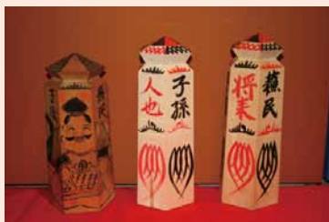
蘇民将来符

信濃国分寺の八日堂縁日で頒布される蘇民将来符や全国各地の護符をわかりやすく展示。室町時代の古文書「牛頭天王之祭文」や江戸時代の「八日堂縁日図」も特別に公開される。