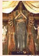
立木観音

立春の前日、春の節が始まる日の祓えの行事。鬼の侵入を防ぐ日と言われ、鬼やらいの日、追儺(ついな)とも呼ばれる。※2月4日(土)~3月2日(金)観音像修復の為、拝観不可