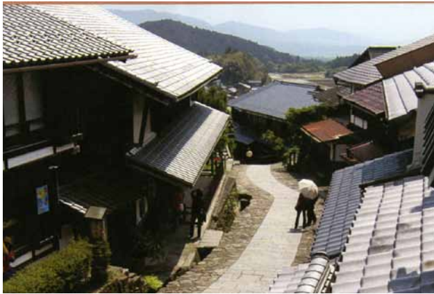
(左)馬籠宿 (右)中津川市中山道歴史資料館

中津川市中山道歴史資料館は、江戸幕府直轄の中山道に残る中津川宿に佇む。中津川宿は江戸と京都の中間地点。皇女和宮降嫁の行列の様子や「薩長同盟」の密談など幕末維新の人々の様子を伝える古文書を展示。妻籠と美濃の間、馬籠宿。江戸時代に本陣や民家、寺や神社が造られた。両側に石垣を築き屋敷を造るこの坂の宿で島崎藤村が誕生する。