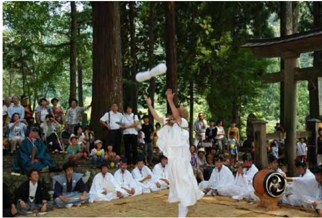
(左)明建神社 七日祭 写真提供:古今伝授の里フィールドミュージアム (右)和歌文学館内 写真提供:古今伝授の里フィールドミュージアム