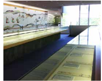
古今伝授の里フィールドミュージアム

岐阜県郡上市大和町牧912-1 TEL:0575-88-3244 (開)9:00-17:00 (休)火(祝祭日の場合は翌日)年末年始 (料)大人500円 小人250円