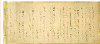
古今和歌集卷第十九残巻(高野切本)平安時代