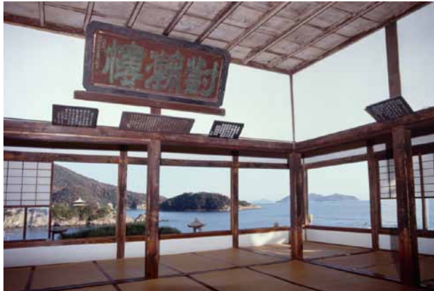
(左)対潮楼 (右)福山市鞆の浦歴史民俗資料館・鯛網コーナー