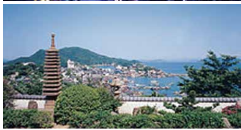
(上)鞆の浦 (下)医王寺

医王寺 広島県福山市鞆町後地1396 TEL: 084-982-3076 (開)境内自由 (休)無 (料)無