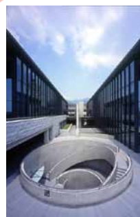
兵庫県立美術館 円形テラス