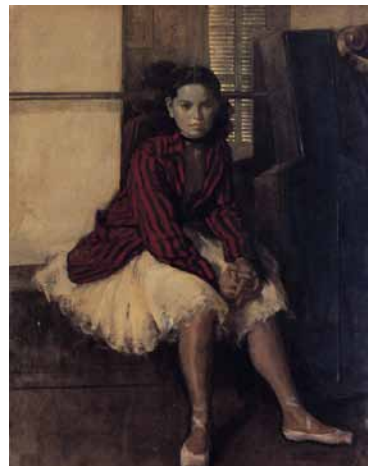
踊り子 小磯良平作 所蔵・写真提供:神戸市立小磯記念美術館

日本列島は実はひとつの地層ではなく、2億5000万年前から堆積した陸や海の地層が北や南、西や東から集まりかさなりあって出来ている。1300年前大和政権が律令国家となり、その日本の成り立ちにそって各地方を区分したのが畿内七道だった。