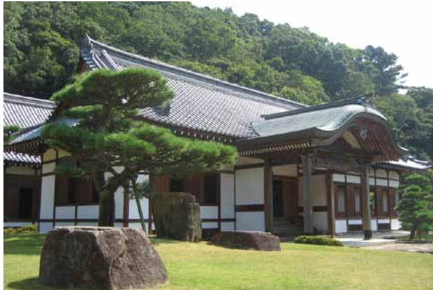
(左)龍野城

古代より砂鉄を多く産した中国山地。播磨灘に注ぐ揖保川。たつの市立龍野歴史文化資料館では、揖保川に沿った歴史、石器・縄文時代、弥生・古墳時代を出土遺物で紹介し、藩祖・脇坂安治が賤ヶ岳で使用した十文字槍や鎧具足を展示。龍野城は、室町時代の鶏籠山頂の山城と江戸時代の藩主脇坂安政が再建した山麓の平山城は、本丸御殿を復元。城下町は播磨の小京都と呼ばれ、武家屋敷や商家・寺町が昔ながらの風情。龍野公園内藩主脇坂氏の上屋敷にある聚遠亭は、風雅な茶室で、池に映る姿は優美。