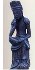
(右)菩薩半跏像 銅像鍍金 7世紀中頃(白鳳時代)

たつの市立龍野歴史文化資料館 兵庫県たつの市龍野町上霞城128-3 TEL:0791-63-0907 (開)9:00-17:00(休)月(祝)の翌日 (料)大人200円、小中高生100円