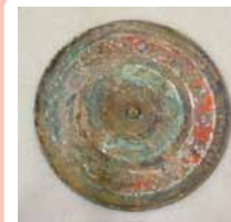
彩画(彩文)鏡 中国 戦国~前漢時代 前5世紀 九州国立博物館蔵