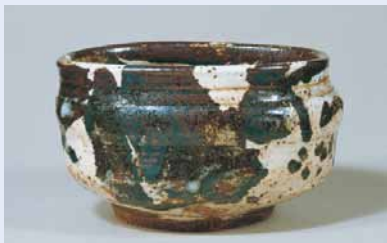
御所丸茶碗 朝鮮王朝時代

取り合わせられる道具類や茶室によって表情を変え、季節感を楽しめる茶の湯の道具を、本展では三井各家旧蔵の茶道具でその一部を取り合わせて紹介する。