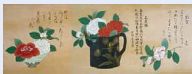
百椿図(2巻のうち) 江戸時代 17世紀 所蔵・写真提供:根津美術館

100種以上の園芸品種の椿を描いた「百椿図」2巻、計約24mのほぼ全容を展示。室町時代の花鳥画や江戸時代の工芸品に描かれた椿図と併せて新春を華やかに飾る。