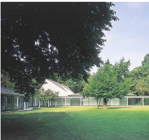
彰考館徳川博物館