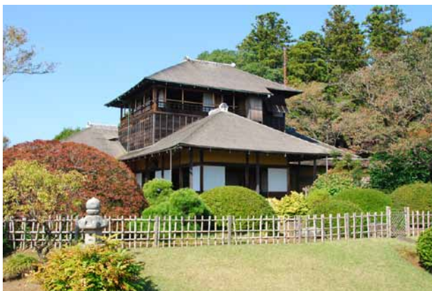
(左)好文亭 写真提供:偕楽園 (右)偕楽園 写真提供:偕楽園