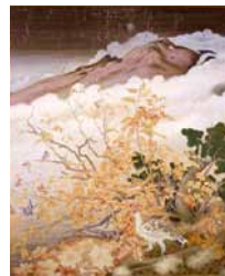
山の秋 玉井敬泉 昭和・20世紀 石川県立美術館蔵 ※展示期間は要問合せ