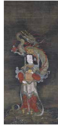
普女竜王図 長谷川信春(等伯) 室町末期

石川県七尾美術館 石川県七尾市小丸山台1-1 TEL: 0767-53-1500 (開)9:00-17:00 (休)月、祝の翌日 (料)内容により異なる