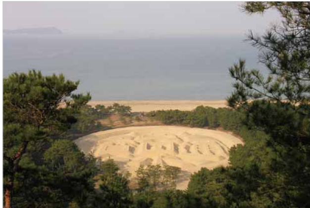
(左)琴弾公園 銭形砂絵「寛永通宝」(右)観音寺市郷土資料館