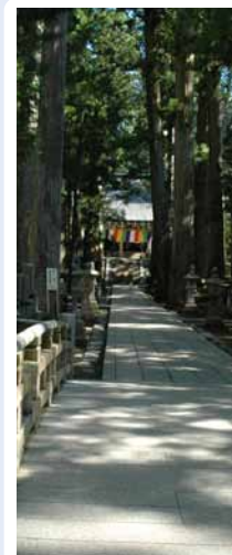
金剛峯寺 一の橋から奥之院