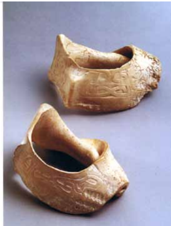
広田遺跡出土 オニシ製貝輪