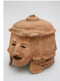
(右)神領10号墳出土 盾持人埴輪