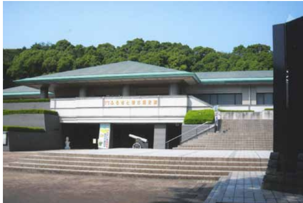
(左)ふるさと考古歴史館