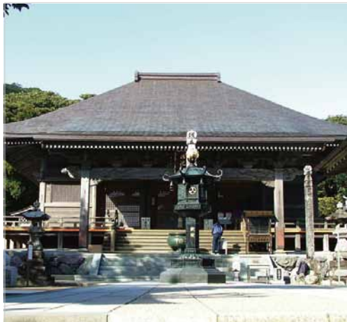
金剛福寺