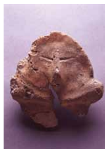
居徳遺跡群出土土偶 所蔵(財)高知県立埋蔵文化財センター

高知平野西側に位置する土佐市高岡町居徳遺跡群から出土した殺傷痕のある人骨や全国最大級で県内初出土の土偶、国内に類例のない精巧な文様で装飾された縄文時代晩期の木胎漆器などからは、東日本の亀ヶ岡文化の影響や、中国との関係が考察され、海流に沿って築かれた壮大な縄文文化ネットワークの存在を窺わせる。