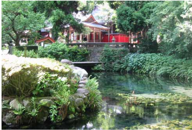
(左)白川水源 (右)湧水トンネル