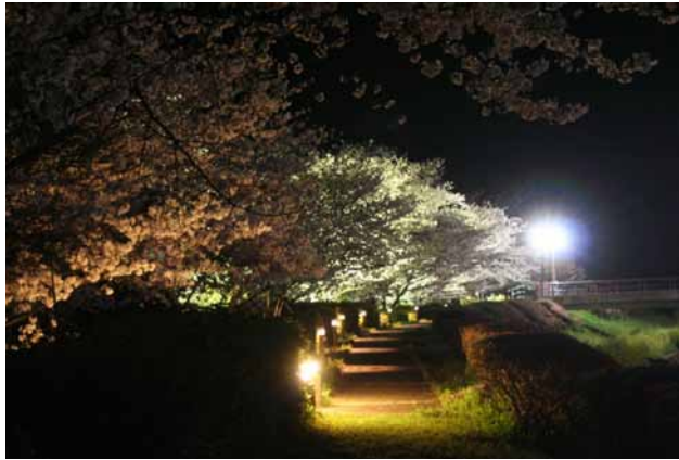
(左)天草コジジョ跡公園 (右)活版印刷機(複製) 天草コレジオ館蔵

季節により様々な表情をみせる天草コレジオ跡公園。緑道を約2kmほど歩けば見えてくる天草市立天草コレジオ館。ヨーロッパにルネサンスを生み出した活版印刷技術が南蛮船に乗り、遠く日本に伝わったのが16世紀。当時の南蛮文化の資料を多数所蔵する天草コレジオ館では日本に伝わった活版印刷機の複製機が展示されている。