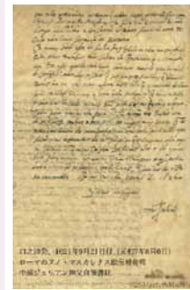
中浦ジュリアン神父自筆書状 日本二十六聖人記念館蔵

天正遣欧少年使節(1582)のひとり、中浦ジュリアン神父が1621年、ローマの古い知人に宛てた手紙。「信仰のために起こり得る全ての迫害に一身を投じる人々と共に」と書かれている。日本二十六聖人記念館は、26人の殉教者の美徳を称えとともに、聖フランシスコ・ザビエルの渡来以降明治政府下の宗教弾圧に至るまで、330年間の日本におけるキリスト教の歴史を紹介する。