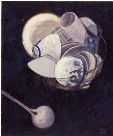
坂本善三(静物(茶碗))

「グレーの画家」として知られる坂本善三。その抽象的な画風の形成された道のりをたどる。