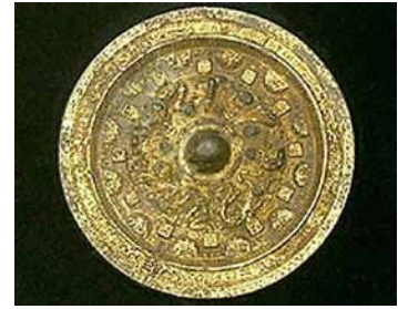
熊本県立熊本博物館

熊本市古京町3-2 TEL:096-324-3500 (開)9:00-17:00 (休)月(祝の翌日)年末年始(12月29日~1月3日)