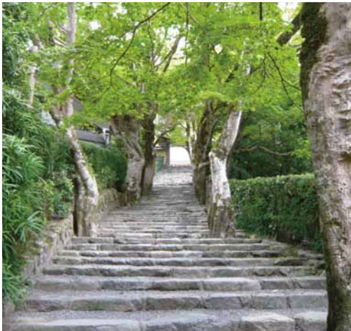
寂光院 緑の参道