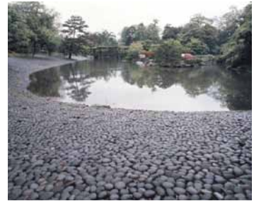
京都御所・仙洞御所 京都市上京区京都御苑 (問合せ)宮内庁京都事務所参観係 TEL:075-211-1215 拝観時間等については宮内庁京都事務所参観係に要確認