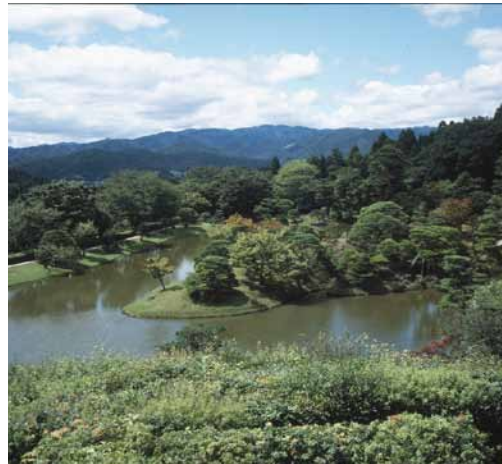
修学院離宮