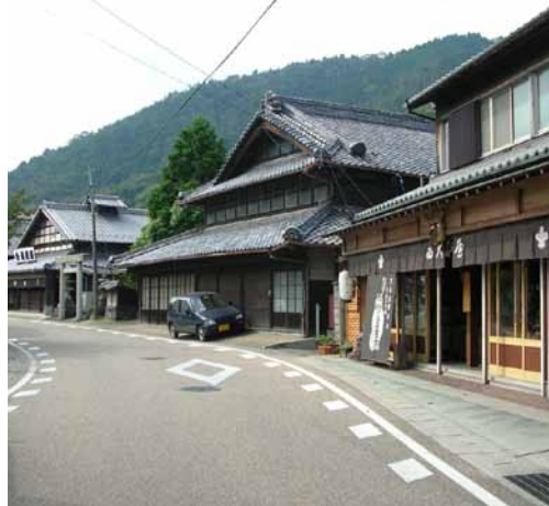
桑名市多度町の古い町並