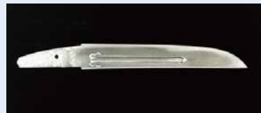
国宝 短刀 無銘 正宗 名物 庵丁 正宗

室町時代以降「名物」と呼ばれた名刀を一室に集めた展覧会。鎌倉時代以降の武将たちが愛蔵した名刀や名物刀剣が紹介され、その始まりから後世に至る展開、評価の定着を明らかにされる。