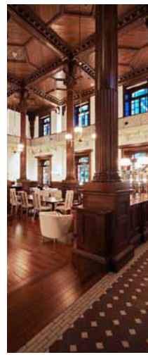
三菱一号館内施設 Cafe 1894