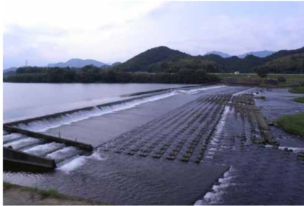
(左)岩熊井堰 (右)内藤記念館

江戸時代、延岡の農業は10年かけて家老・藤江監物による洪水を溢れさせて防ぐ岩熊井堰によって飛躍的に発展する。150石の米の収穫量が755石にまで伸びる。延岡城跡地公園内の内藤家御殿跡に建築された内藤記念館では、桃山から江戸初期にかけ「天下第一」の称号を与えられた能面などの作品が30点並ぶ。延岡藩の豊かさの表れ。