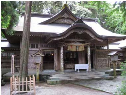
高千穂神社