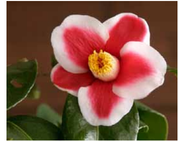
旧五輪教会(久賀島)、椿 玉の浦 (問合せ) 五島市観光協会 TEL:0959-72-2963