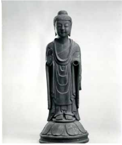
重文 金銅薬師如来立像