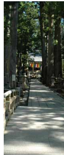
金剛峯寺 一の橋から奥之院