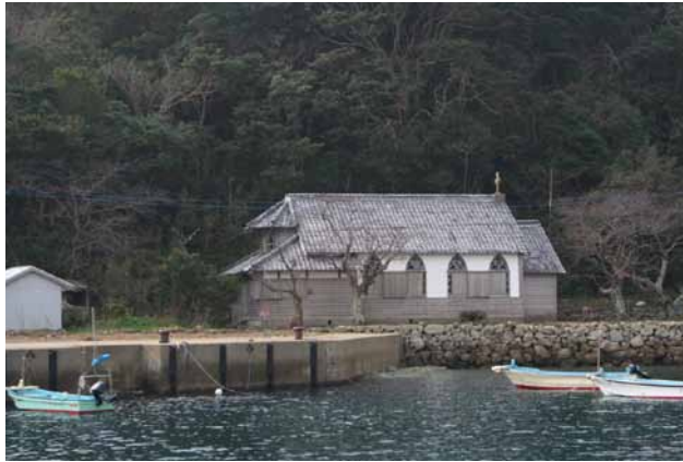
(左)旧五輪教会 写真提供:五島市観光協会 (右)椿 写真提供:五島市観光協会