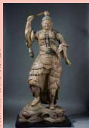
持国大権(空弁)時代・聖観音文化財 所蔵・写真提供:薬師寺

大和に春をよぶ火祭り。ひとの罪や穢れを仏前に懺悔し、身も心も清浄にして、新年を迎えるため、悪魔退散、無病息災、万民豊樂を祈る「修二会」の最終日の正月行事最後の大法要。