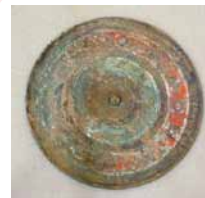
彩画(彩文)鏡 中国 戦国～前漢時代 前5世紀 九州国立博物館蔵