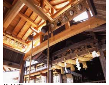
総社宮 総社市総社2-18-1 TEL:0866-93-4302 (開)境内自由 (休)無 (料)無 吉備路風土記の丘 (問合せ)総社市役所商工観光課 TEL: 0866-92-8200