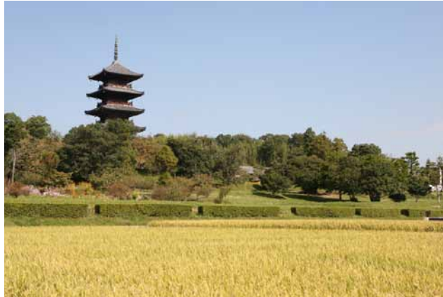
(左)国分寺と秋の稲穂 (右)総社宮 本殿

吉備文化発祥の地、造山古墳群。全国第4位の巨大古墳は、5世紀の前半河内に匹敵する吉備の王がいたことを物語る。アカマツ林を借景に静かに佇む備中国分寺五重塔。田園風景と史跡が調和する景観。総社宮は備中324社の神を合祀する。前庭の三島式庭園は古代様式で、長い回廊が美しい影を水面に映す。拝殿には円山応挙はじめ多くの絵馬が奉納される。