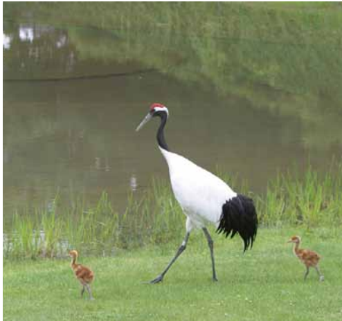
きびじつるの里