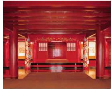
首里城公園 沖縄県那覇市首里金城町1-2 (問合せ)首里城公園管理センター TEL:098-886-2020 (開)8:30~20:00(7月~9月)入館券販売締切19:30 (休)7月の第1水曜日とその翌日 (料)大人800円、高校生600円、小中生300円