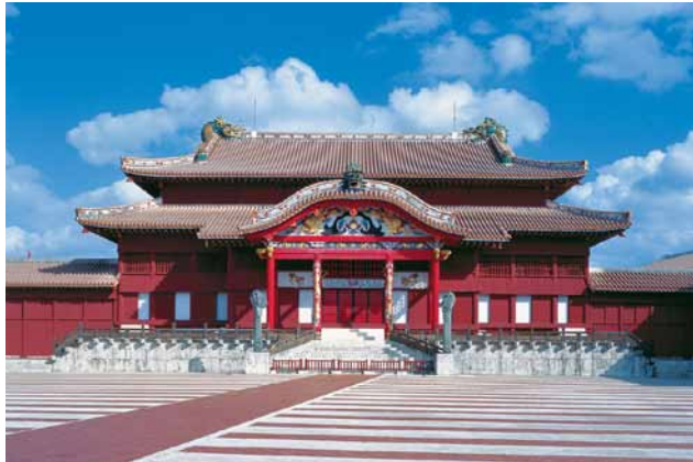
(左)国営沖縄記念公園(首里城公園):首里城正殿 (右)国営沖縄記念公園(首里城公園):首里城御差床1F

那覇港を見下ろす丘陵地に首里城がある。正殿に向かって右手の「南殿」では薩摩の役人をもてなし、左手の「北殿」では中国の冊封使をもてなす。正殿や「守礼門」是和様・唐様を折衷する琉球独特の建築様式。この様式に見える智慧には深さがある。琉球王朝の歴史、沖縄の歴史と文化を象徴する首里城跡は、2000年に世界遺産に登録される。