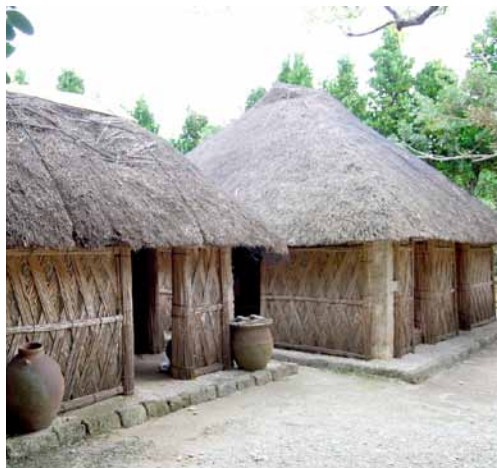
海洋博公園おきなわ郷土村・本部の民家