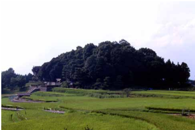
(左)推古天皇陵 写真提供:大阪府南河内郡太子町教育委員会 (右)竹内街道歴史資料館 写真提供:大阪府南河内郡太子町教育委員会

太子町立竹内街道歴史資料館では、飛鳥時代の、推古天皇の命により置かれた難波の港から飛鳥の都に至る最古の国道を紹介。また石器の材料として使われていたサヌカイトを得るために二上山に通じていた道を整備した歴史や、聖徳太子信仰やお伊勢参りや西国三十三所巡礼の道の歴史、大和と河内を行き来する商人たちの道の歴史も紹介。