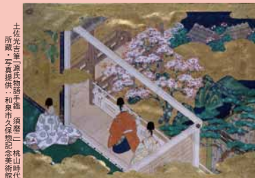
土佐光信「源氏物語手鑑」(複製) 須藤二 桃山時代

「源氏物語手鑑」や伊勢物語を描いた江戸絵画を中心に約40点で構成する美術館所蔵品による物語絵の展示。物語の伊勢、源氏の世界を色紙や扇面、小襖や屏風作品で味わう。