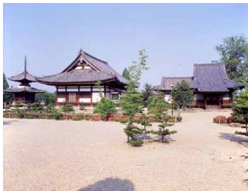
磯長山 叡福寺