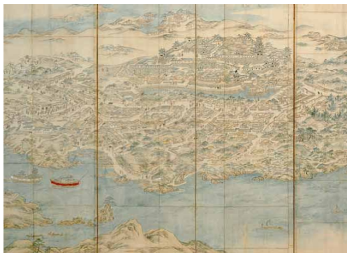
肥前名護屋城図屏風