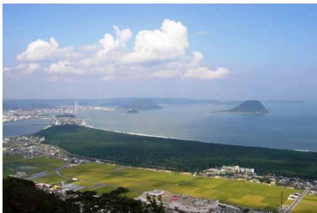
(左)虹の松原 (右)古代の森会館

佐賀県唐津市「めずらの里」。東の名所・鏡山、山頂には鏡山神社。麓には鏡神社があり、展望台からは唐津藩初代藩主・寺沢広高が造った日本三大松原の虹の松原や唐津湾、更には遠く杵岐まで見渡せる。鏡神社近くの古代の森会館では、弥生時代の出土品をはじめ、近世までの出土品を展示。大陸とのつながりがあった歴史見渡せる。