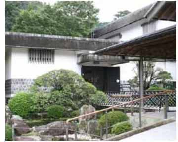
柿右衛門古陶磁参考館 佐賀県西松浦郡有田町南山丁352 TEL:0955-43-2267(柿右衛門窯) (開)9:00-17:00 (休)無