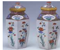
色絵花鳥文六角壺 1670-90年代(江戸時代前期) 佐賀県立九州陶磁文化館蔵