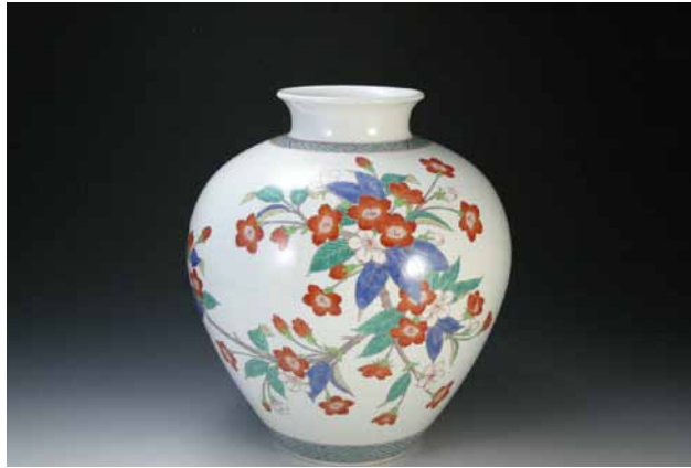
(左)濁手 桜文 花瓶 写真提供: 柿右衛門窯 (右) 柿右衛門古陶磁参考館 写真提供: 柿右衛門窯