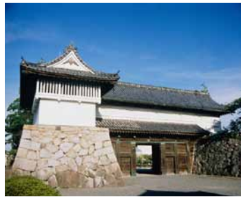
佐賀城 佐賀城公園管理事務所 佐賀市内1丁目10-11 TEL/FAX: 0952-22-5047