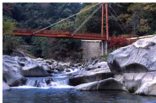
雄淵雌淵 (注) 写真は塗装前