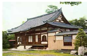
(左)円照寺板石塔婆 写真提供:円照寺 (右)円照寺 本堂 写真提供:円照寺