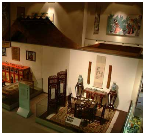
入間市博物館ALIT