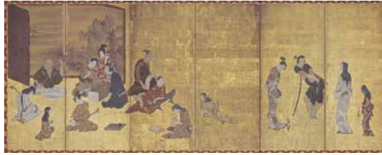
(左) 国宝 風俗図(彦根屏風)

彦根城は一度も戦をせず、天守は藩主が使うより城下から見上げる彦根藩の象徴だった。藩主井伊家に伝来した風雅な大名道具や歴史伝える古文書を多数所蔵する彦根城博物館。多彩な分野の作品を展示する。彦根城に隣接する玄宮園は、延宝5(1677)年、4代頭主井伊直興により造園。玄宮園の名は、中国宮廷の庭園に由来する。