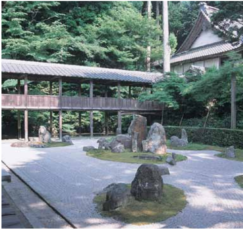
龍潭寺庭園