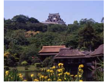
(右) 玄宮園と彦根城

滋賀県彦根市金亀町1-1 TEL:0749-22-6100 (開)8:30-17:00 (休)12月25日~12月31日 (料)一般500円、小中生250円