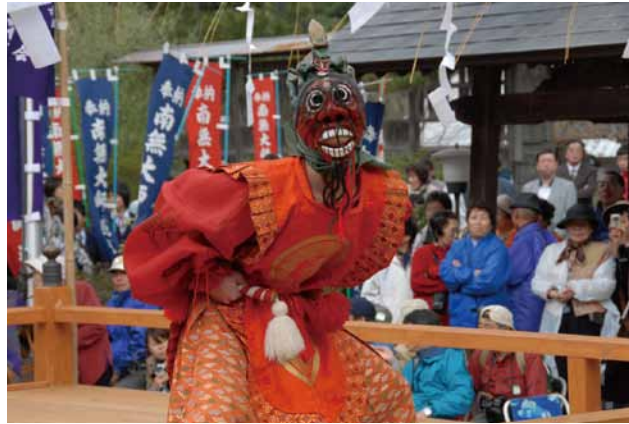
(左)隠岐国分寺・蓮華会舞 (右)水若酢神社