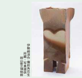
伊勢屋淳作(備前角花生陶山)島根県立歴史博物館蔵

山陰道 島根県立 古代出雲歴史博物館 島根県出雲市大社町杵築東99-4 ☎0853-53-8600 特集展「備前焼-土と炎の芸術-」 平成23年12月28日(水)~平成24年2月26日(日) 歴史の絆、島根県と岡山県との文化交流事業。中世六古窯の一つ、備前焼900年の歴史を岡山県立博物館の館蔵品を中心に、人間国宝作家の作品も併せて一堂に展示。