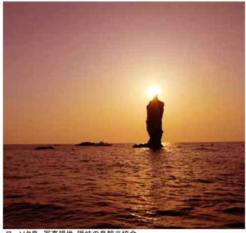
ローソク島