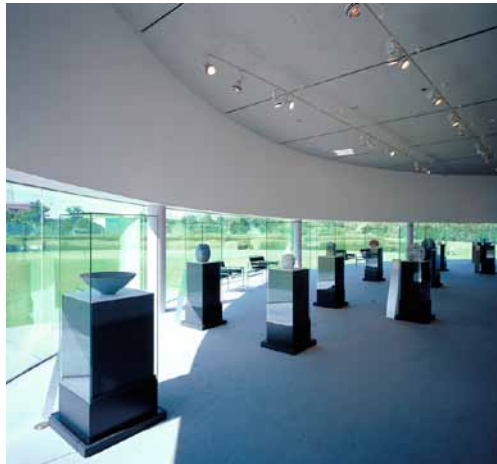
アートハウス常設展示室