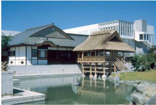
(左)お茶の郷 (右)

日本一のお茶処牧之原台地に佇み、世界のお茶や地元の深蒸し煎茶を味わいながらお茶の文化や歴史が学べる博物館、お茶の郷。作庭家の大名茶人小堀遠州が手掛けた建物を復元した書院と茶室があり、庭園は京都御所内の仙洞御所の東庭を造園当時のまま復元。石の配置、組み合わせ、綺麗で自然の美を締める遠州の特徴がよく表れる。