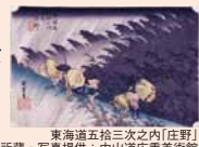
東海道五拾三次之内[庄野] 所蔵・写真提供:中山道広重美術館

東山道 中山道広重美術館 岐阜県恵那市大井町176-1 ☎0573-20-0522 企画展 「保永堂版東海道五拾三次之内」 平成24年3月8日(木)~4月1日(日) 東海道五拾三次之内[庄野] 所蔵・写真提供:中山道広重美術館 江戸期の浮世絵版画より、歌川広重の代表作「東海道五拾三次之内」を全点揃いで展示するとともに、初お披露目の稀品を公開し、江戸時代の東海道の旅路を紹介。