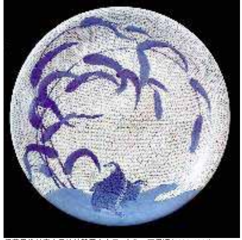
伊萬里染付鹿之子地紋鶏粟文大皿 文化〜天保頃(1804-1844)