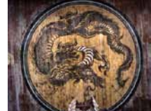
法堂 蟠龍図

知的で品のある狩野光信の龍 禅宗寺院の法堂は、住持が仏法の要諦を説く最も重要な伽藍。相国寺の法堂は、1605(慶長10)年豊臣秀頼が建立した最古で最大の法堂建築。1788(天明8)年の大火から法堂を守ったのは天井に描かれる仏法守護の八神、八部衆の龍。室内中央で手を叩くと、床と天井面の仕組みでカラカラ音が返る「鳴き龍」は、天才絵師・狩野永徳の長男で、知的かつ穏やかな作風の光信の筆によるもの。 *12月8日まで公開