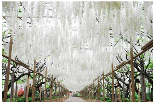
(左)あしかがフラワーパーク 白藤 (右)史跡足利学校