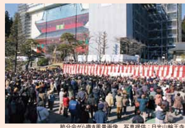
節分会から撮影風景画像

東山道 日光山輪王寺 栃木県日光市山内2300 ☎0288-54-0531 節分会追儺式 平成24年2月3日(金)12:00、14:45 (2回) 年の節目に当たる立春の前日に一年間の無事を祈る。大法要後、年厄除追儺の豆撒きを行い、仕上げに「縁喜がらまき」を行う、厳粛かつ賑やかさに荘厳な境内は包まれる。