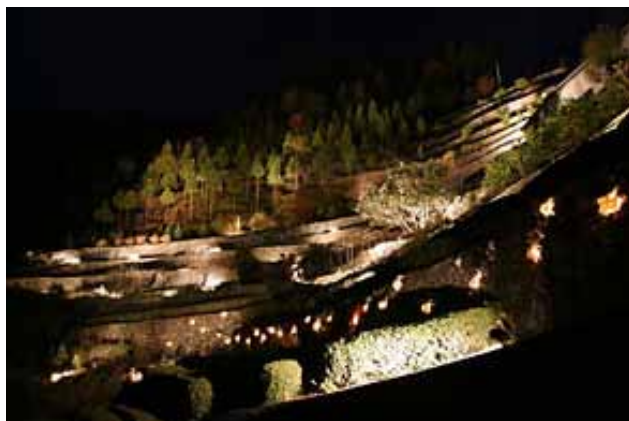
(左)高開の石積ライトアップ (右)美郷ほたる館(裏)