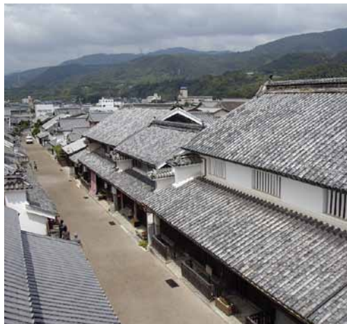
うだつの町並み