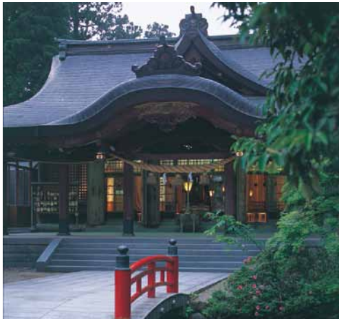
高瀬神社