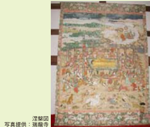
涅槃図 瑞龍寺 写真提供:

「仏涅槃図」を掛け、お釈迦様最後の説法「遺教経」などを読誦し法要を行う。11日の寺内団子作りの、無病息災、災難除けのお守りに大変ご利益がある涅槃団子が撒かれる。