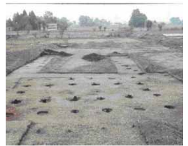
史跡公園「高瀬遺跡」 井波歴史民俗資料館 富山県南砺市高瀬736 (問合せ)南砺市教育委員会 TEL:0763-23-2014