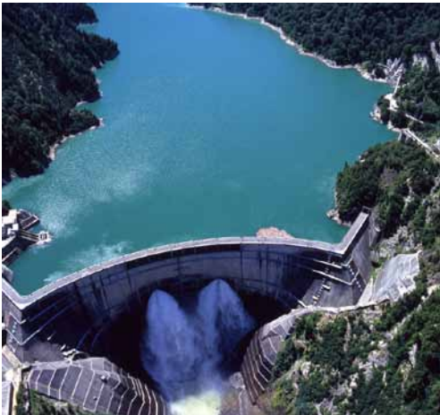
黒部ダム