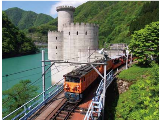
(左)黒部トロッコ電車 (右)うなづき友学館