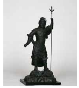
法音寺 山形県米沢市御廟一丁目5番32号 TEL:0238-22-2095 宝物展10月10日まで (開)9:00-16:00 (料)大人200円、大高生150円、小中生無料