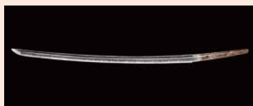
赤羽刀 銘:綱俊是俊 所蔵・写真提供:上杉博物館

太平洋戦争後、赤羽の米兵器補給廠に集積の刀剣のうち37口の譲与を受け、修復後の20口のお披露目。館蔵の刀剣、古文書を加え、米沢の刀鍛冶系譜を辿り新々刀の歴史を紹介。