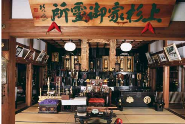
(左)上杉家御霊所 写真提供:法音寺 (右)泥足毘沙門天尊 写真提供:法音寺

法音寺は真言宗(豊山派)の寺院で、山号は八海山。もとは越後国南魚沼郡の八海山の麓にあって、上杉家の移封に伴って越後から会津そして米沢城二の丸に移り歴代藩主の菩提寺となる。泥足毘沙門天尊は越後春日山城本丸北側にあった毘沙門堂の本尊で謙信が最も崇拝し日々祈りを込めた仏像。武将の名門、上杉家の歴史を今に伝える。